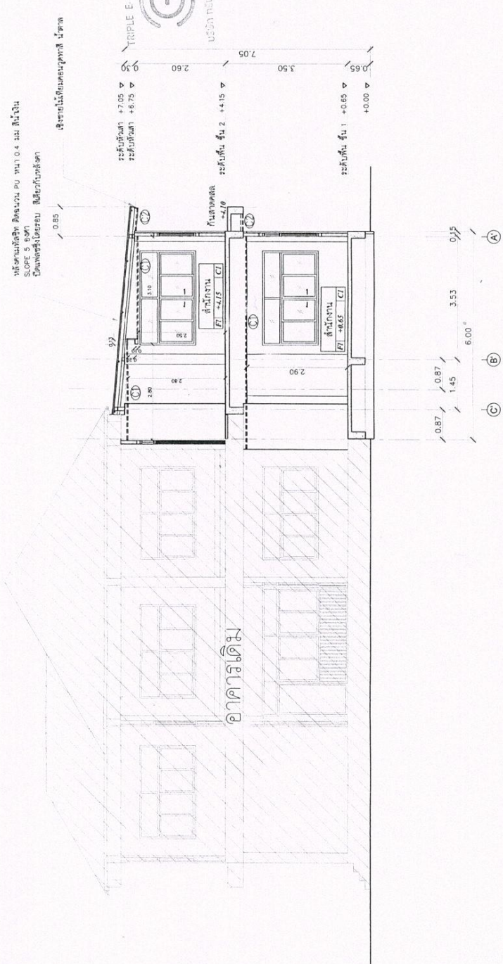
รูปตัด A-A SCALE 1:100